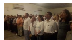
Instalación FAVL Monagas