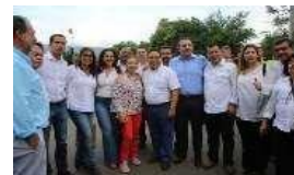
Sesión extraordinaria Frontera Colombo Venezolana