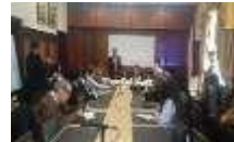
Inicio del proceso para la formación de la Ley de Cambio Climático en Venezuela