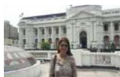
Foro Cumbre Democrática por Venezuela. Lima Perú