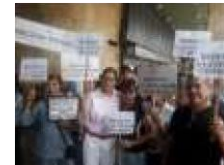
Protesta trabajadores públicos. Plaza Caracas.