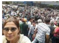
Protesta pacífica frente ONU PDNU Caracas