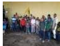
Recorrido parlamentario por los municipios del estado Monagas.