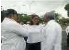
Protesta Gremio Médico.