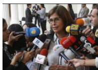
Rueda de prensa AN sobre grave situación petrolera en Monagas.