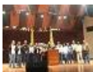
Instalación FAVL. Aula Magna UCV. Ccs