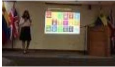
Presentación Objetivos Sustentables Webminster