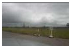
Inspección al campo petrolero y su grave crisis Municipio Zamora. Monagas