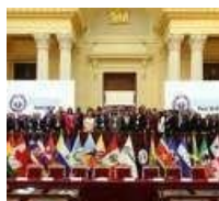
VIII Cumbre de las Américas