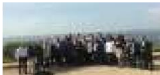
Sesión extraordinaria AN Maracaibo Edo Zulia